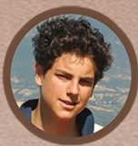
BLESSED CARLO ACUTIS MAY 3, 1991 - OCTOBER 12, 2006