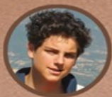
BLESSED CARLO ACUTIS MAY 3, 1991 - OCTOBER 12, 2006