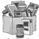
Feeding the Community

As you place your gift in the CRS Rice Bowl know that you are a sign of God's love to those who carry their cross of suffering and pain.